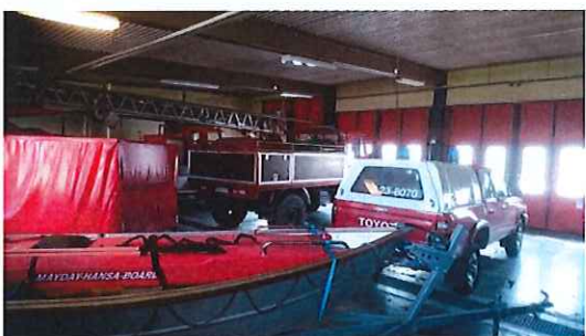
Servicebil årsmodell 2003

Ludvika kommun tillhandahåller fordon åt Ljusnarsbergs kommun. Detta ingår i avgiften för Ljusnarsberg utan att denna del är särskilt specificerad.