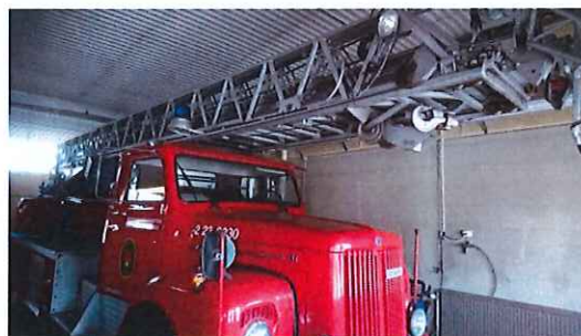
Stegbil årsmodell 1976