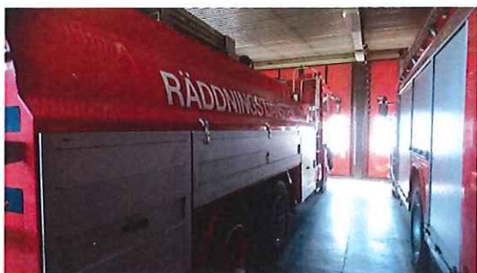
Tankbil årsmodell 1989