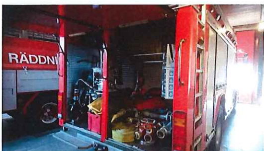
Släckbil årsmodell 2008