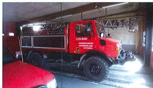
Terrängbil årsmodell 1989